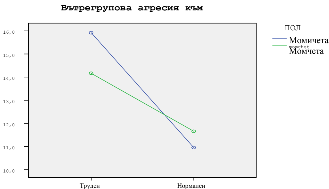
Фиг. 2. Влияние на вид клас и пол върху вътрегруповата агресия

интерактивно видът клас и пол /фиг.2/. При седми ( F=36.5 p<.000 ) и девети ( F=36.9 p<.000 ) клас значим ефект оказва само видът клас. Отново при по-малките класове е налице интерактивен ефект на двата фактора върху проявите на агресия сред членовете на трудния клас, което потвърждава отслабването на ролята на пола в по-горните класове. Това е логичен резултат, както от гл.т. на резултати от други изследвания относно твърде високата агресивност на момичетата, “достойно” конкурираща момчешката агресия. От друга страна, достатъчно факти от изследвания са налице в литература относно все по-голямото сближаване на сила и степен на агресивност на двата пола и в извадки с възрастни респонденти /Зографова, 2001/.