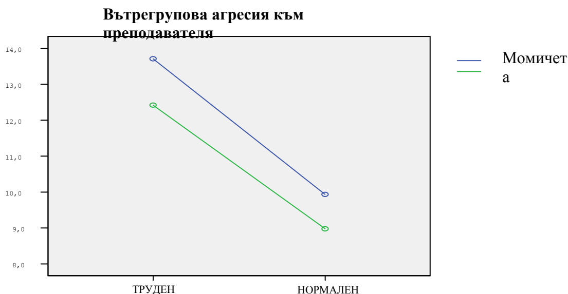
Фиг. 3. Влияние на вид клас и пол върху вътрегруповата агресия към преподавателя.

Резултатите от двуфакторния анализ сочат, че при пети ( F=5.00 p>.032 ), седми ( F=37.2 p<.000 ) и девети ( F=20.9 p<.000 ) клас влияние върху вътрегруповата агресия към преподавателя оказва видът клас. По тази скала единствено при шестите класове ( F=14.8 p<.000 ) се наблюдава интерактивно влияние на вид клас и пол /вж. фиг.3/. Освен това полът влияе върху резултатите по фактора вътрегрупова агресия насочена към преподавателя ( F=4,63 Sig=0,03 ), но очевидно с отслабващо влияние /вж. по-горе и при други видове агресия/ при по-горните класове.